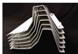
収納・運搬時の 段積み可能(最大15段)